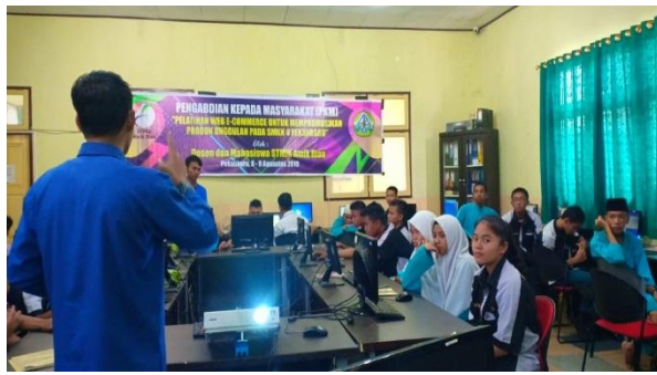
Gambar 2. Penyampaian Materi dan Praktek.