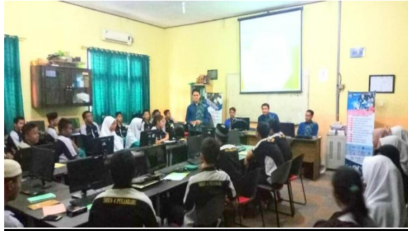
Gambar 1. Penyampaian Materi.

dan memaksimalkan potensi e-commerce. Dengan adanya pelatihan ini kami siswa-siswi dapat lebih mengeksplorasi lagi kemampuannya sehingga dapat memberikan manfaat bagi sekolah dalam memasarkan produk kreatifnya serta manfaat bagi masing-masing siswa untuk menerapkan e commerce dalam berbagai bentuk usaha online.