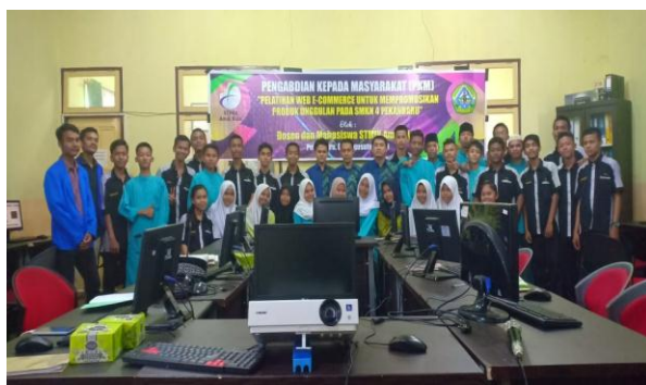
Gambar 3. Foto Bersama Siswa/i.